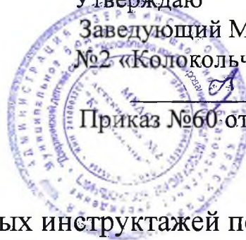
График проведения плановых инструктажей по пожарной безопасности на 2023-2024 учебный год.